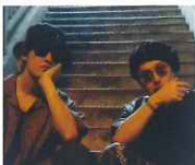
エンターテインメントユニット ウルトラソウル