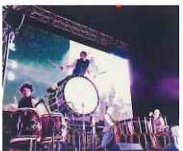
和楽器 X コンピュータミュージックパフォーマンス TRA innovation