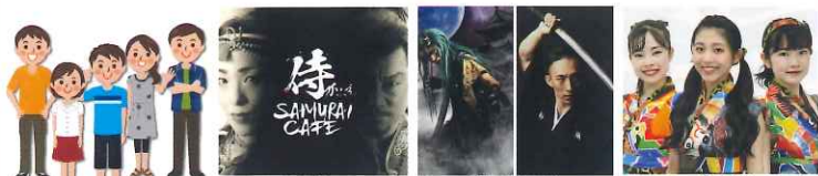
舞踏 / ダンス 侍かふえ