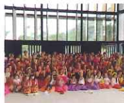
ダンス (ハワイアンフラ&ウチナーフラ) フラサークル kapalili